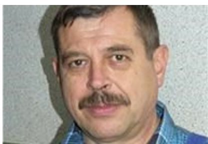
Učenje stranoga jezika za 2 TJEDNA