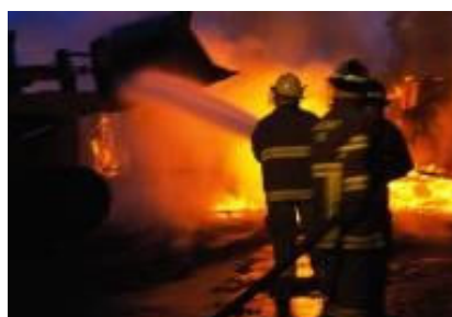
Eksplוזija plina iz neispravnog crijeva spalila dio kuće